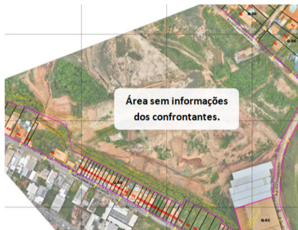
Figura 2 – Mapa enviado pela empresa

- Identificar e indicar matrícula de todos os confrontantes no mapa. Quando não for possível identificar a exata origem da parcela matriculada, indicar a expressão ‘proprietário não identificado’. Alguns não foram representados, como mostra a imagem a seguir.